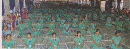
வண்ணார்பேட்டை விவேகானந்தா வித்யாஷ்ரம் பள்ளியில் நடைபெற்ற யோகா பயிற்சியில் பங்கேற்ற மாணவர்கள். (வலது) ஸ்ரீசாரதா மகளிர் கல்லூரியில் நடைபெற்ற யோகா பயிற்சியில் பங்கேற்ற மாணவிகள்.

திருநெல்வேலி, ஜூன் 21: சர்வதேச யோகா தினத்தை முன்னிட்டு திருநெல்வேலியில் பள்ளி, கல்லூரிகளில் வியாழக்கிழமை யோகா பயிற்சி நடைபெற்றன.