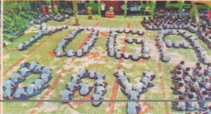
பாளையங்கோட்டையில் புஷ்பலதா மெட்ரிக் பள்ளியில் நடைபெற்ற யோகாசனத்தில் பங்கேற்ற மாணவர்கள். (வலது) லிட்டில் பிளவர் மெட்ரிக் பள்ளியில் நடைபெற்ற யோகா நிகழ்ச்சியில் பங்கேற்ற மாணவர்கள்.

கலை மாணவர்கள் பல்வேறு நிலைகளில் யோகா பயிற்சி செய்தனர். மாணவிகளுக்கு யோகா குறித்து வினாடி வினா நடைபெற்றன.